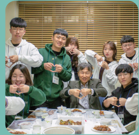
사랑과 나눔의 공동체 인성교육

팀 제도 및 팀 담임교수제 Residential College 새내기 섬김이 내리사랑