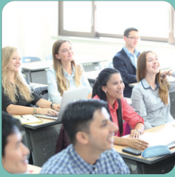
글로벌 교육 환경

해외 출신 학생 15.8% 입학 전공 영어 수업 비율 38% 이상 Handong International Law School