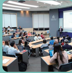
탁월한 전공 역량

복수전공 필수 창의 융합 교육 학부 교육 지원 사업 (대학혁신지원사업, LINC+, SW 등)