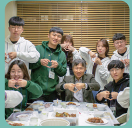
사랑과 나눔의 공동체 인성교육