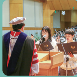
기독교 신앙에 기초한 교육철학