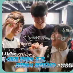
학생 중심 학사제도

해외 출신 학생 15.8% 입학 전공 영어 수업 비율 38% 이상 Handong International Law School