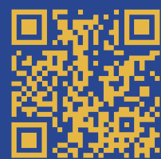
편입학 전형안내 영상